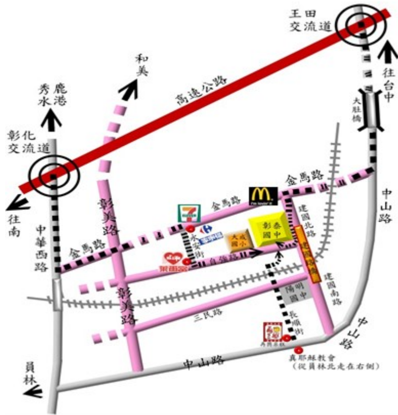
試場位置圖(彰泰國中)